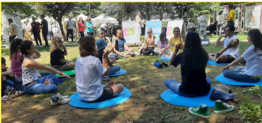
图：二零二二年六月三日至五日，土耳其伊斯坦布尔市的法轮功学员参加了卡迪柯伊市在自由公园举办环境节活动。许多民众被现场法轮功学员祥和的炼功场面所吸引，纷纷加入学功的行列。