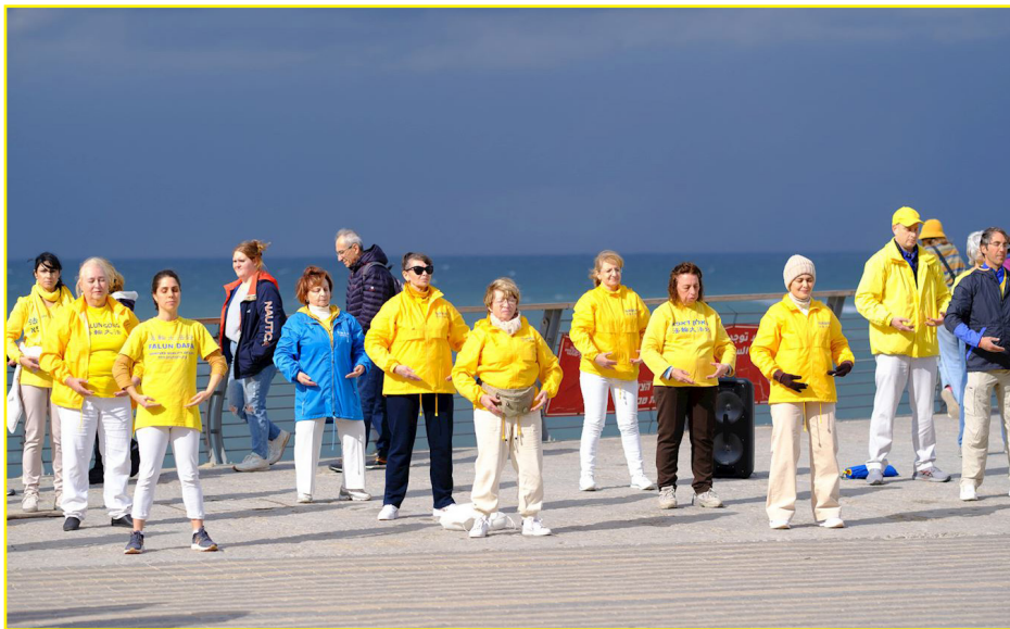
图：以色列法轮功学员二零二三年一月十四日在特拉维夫的老雅法长廊举办了洪法讲真相活动，旨在让公众了解法轮大法的美好，以及中共对中国法轮功学员的迫害，并呼吁制止迫害。