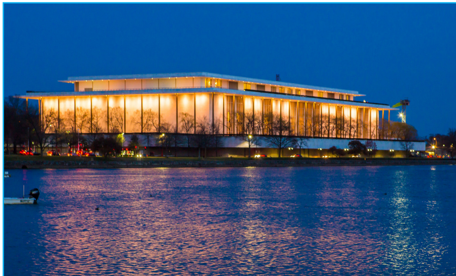
图：二零二四年一月二十六日至二月四日，神韵新世界艺术团在美国首府华盛顿的肯尼迪艺术中心歌剧院上演了十场演出，吸引了近两万名美国政要、艺术界名流、旅美华人以及来自不同行业的主流社会人士。图为肯尼迪艺术中心外景。