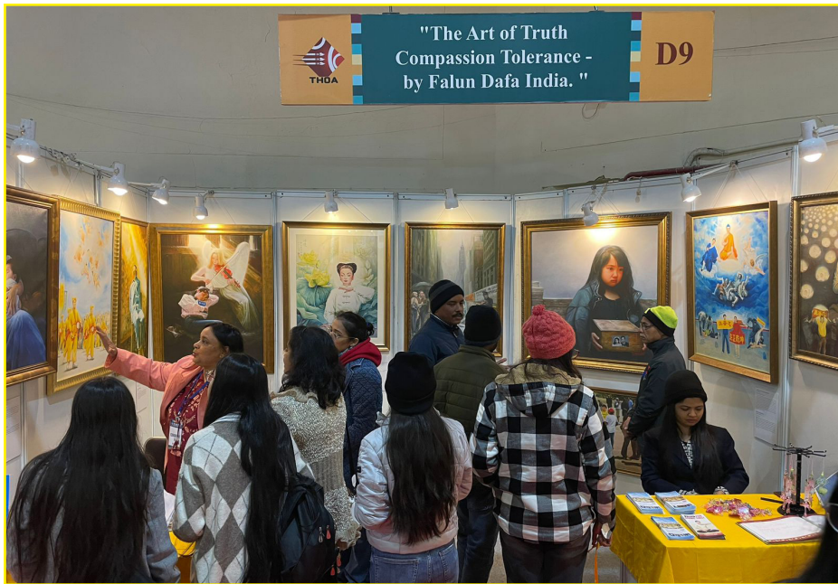
图：印度法轮大法学员一月十九日至一月二十一日参加在首都德里的普拉加蒂·迈丹 (Pragati Maidan) 会展中心举办的 HAAT 艺术展 (HAAT of ART)，展出了学员制作的真善忍美展的部份收藏作品。