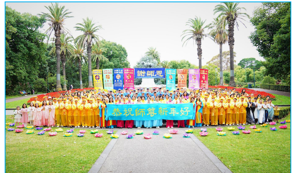
图：澳洲墨尔本法轮功学员恭祝师父新年好。