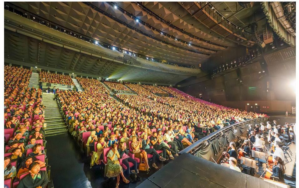
图：二零二五年五月十一日下午，美国神韵纽约艺术团2025演季在法国巴黎国际会议中心的最后一场演出爆满落幕。在过去近五个月里，神韵艺术家们在全球五大洲24个国家，逾190个城市，演出超过800场。