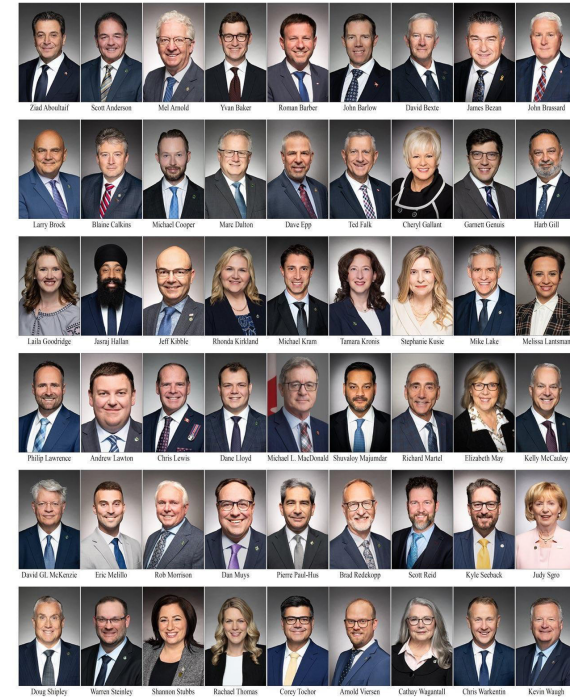
图：加拿大54位议员联合谴责中共迫害和跨国镇压