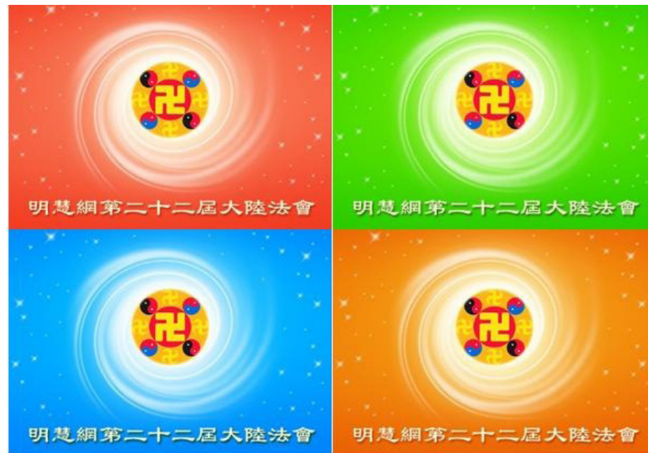
图：明慧网第二十二届中国大陆法会于十一月九日开幕，预计将持续到本月下旬。