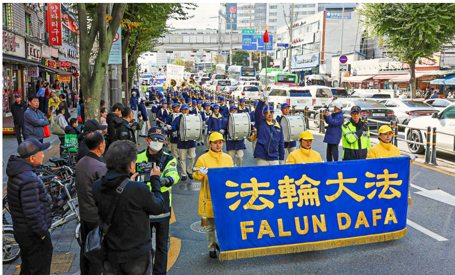
图：法轮大法韩国佛学会十一月二日在韩国首尔最大的华人聚居区九老洞与大林洞一带举行盛大游行。