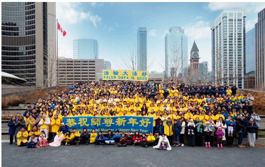
图：加拿大多伦多大法弟子齐聚多伦多市政厅，给师父拜年，恭祝师父新年好！感恩师父将大法传于世间，救度芸芸众生。