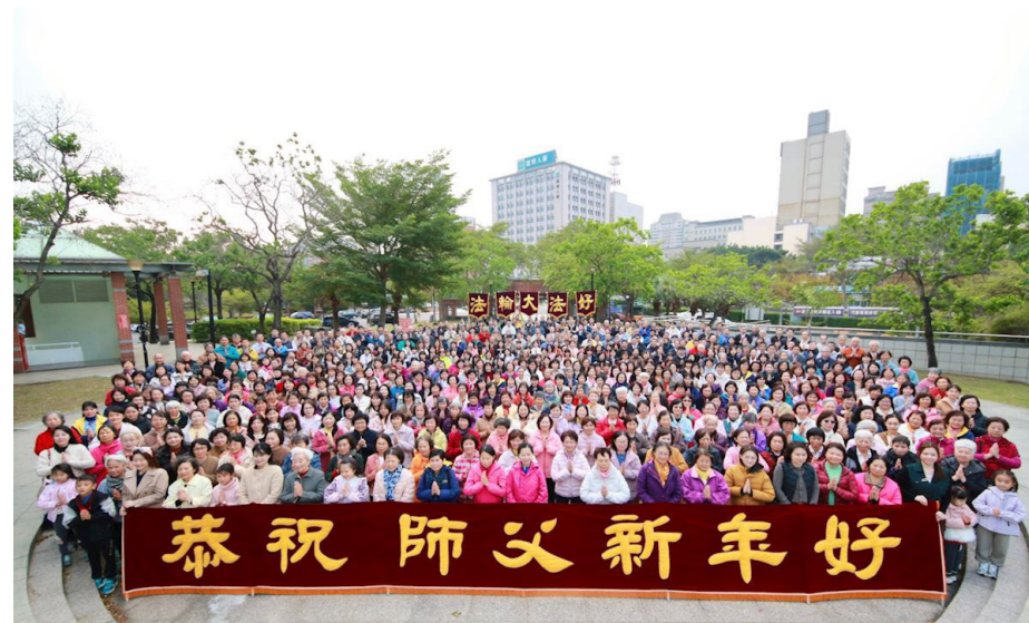
图：台湾西北部桃园市、新竹市、新竹县、苗栗县四县市的法轮功学员二零二五年十二月二十一日齐聚于竹北文化公园，给慈悲伟大的师父拜年，表达对李洪志师父的感恩。大家双手合十、齐贺：“恭祝师尊新年快乐！法轮大法好！真善忍好！”

第 1271 期（2026 年 1 月 2 日） WWW.MINGHUI.ORG