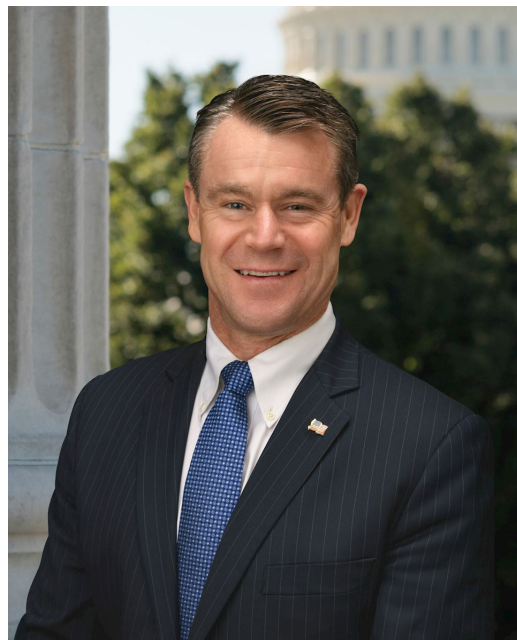
图:印第安纳州共和党参议员托德·杨(Todd Young)联署法轮功保护法案。

参议员杰夫·默克利在今年三月的声明中说:“中国(中共)的镇压和侵犯人权行为,以及活摘弱势群体器官行为,继续造成可怕的后果。我们必须站出来声援这些罪行的受害者,我们的跨党努力是为了追究中国(中共)政府侵犯人权的责任。”