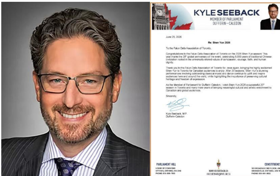
图：大多伦多地区国会议员凯尔·塞贝克（Kyle Seeback）向多伦多法轮大法学会发出贺信，恭贺神韵回到多伦多演出。