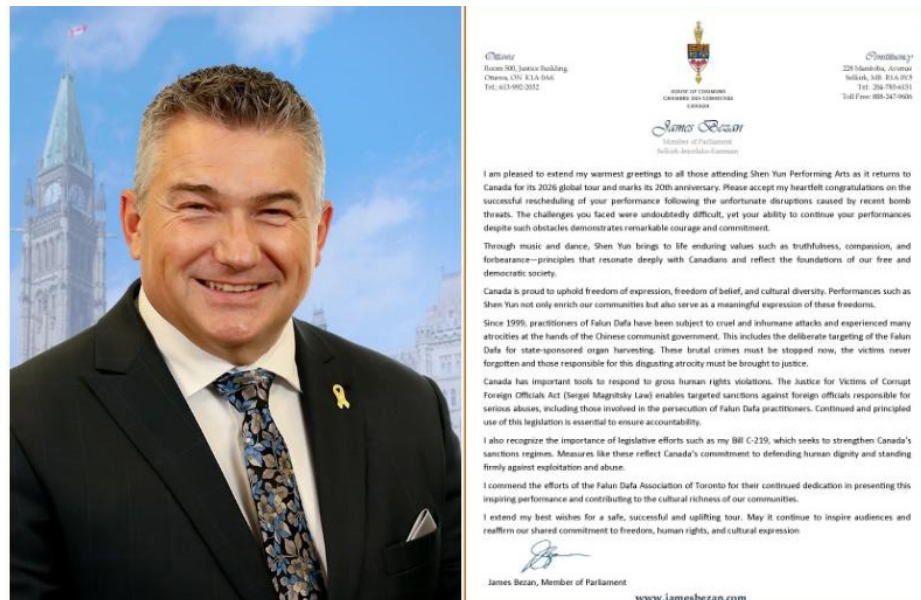
图：加拿大国防部影子部长、联邦国会议员詹姆斯·贝赞 (James Bezan) 向多伦多法轮大法学会发出贺信，恭贺神韵返回多伦多演出。

二零二零年之前，集中清理“公检法”大老虎，落马的主要是政法委、公安部、最高法、最高检以及地方公检法的一把手，如周永康等。二零二一年开始，监狱系统迎来“大地震”，各省大量监狱长、狱警和省监狱管理局局长