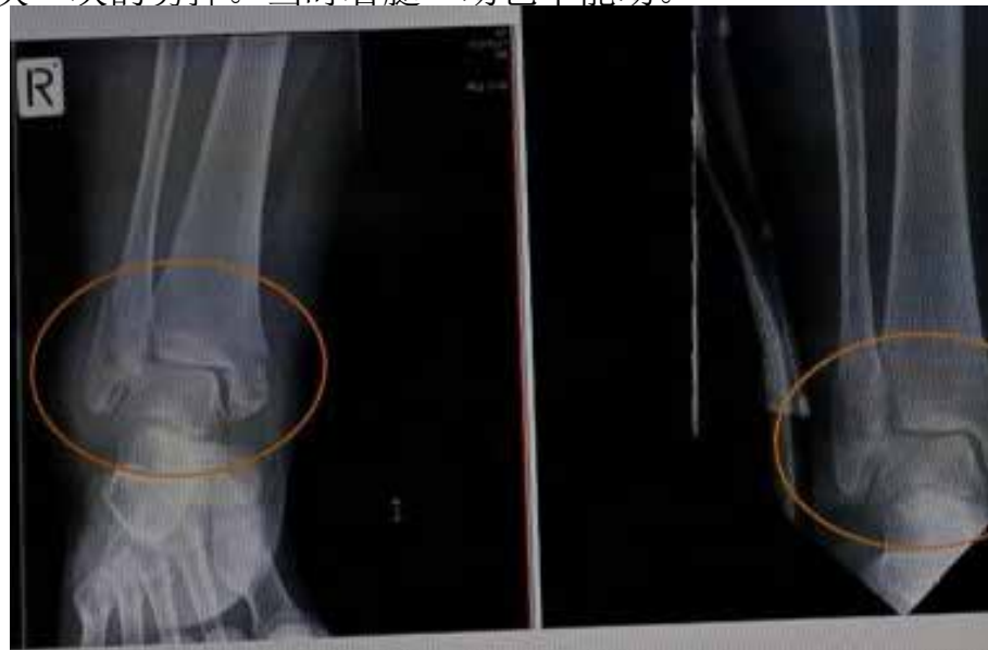
图 2：王久春女士 2015 年 11 月 7 日的踝关节 X 光片（左）与同年 12 月 4 日的 X 光片（右），对比可以看出，车祸 3 周后骨折处已有愈合趋势。

救护人员快速的把我抬到救护车上拉到急救中心，拍了很多 X 光照片。医生在 X 光片子上看到右腿有五处粉碎性骨折：右侧的踝骨和膝盖链接的腓骨完全断了，穿着裤子就可以明显看到骨折处的骨头向外支出；膝盖骨、右腿的左踝骨、右踝骨、右脚后跟，全部是粉碎性骨折。因为右腿肿的厉害，裤子已经绷的很紧，根本脱不下来，医生就用剪刀把裤子一块一块的剪掉。当时右腿一动也不能动。