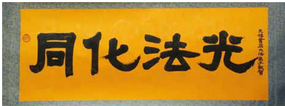
同化法光：天梯书店大法弟子敬贺五一三世界法轮大法日暨师尊华诞！