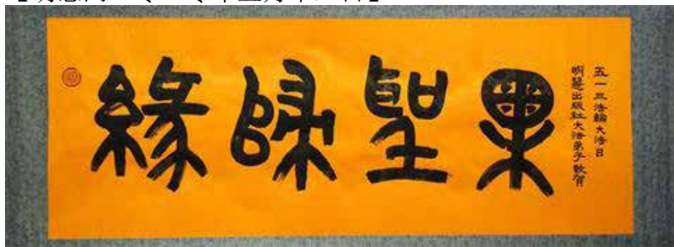
缘归圣果：明慧出版社大法弟子敬贺五一三世界法轮大法日