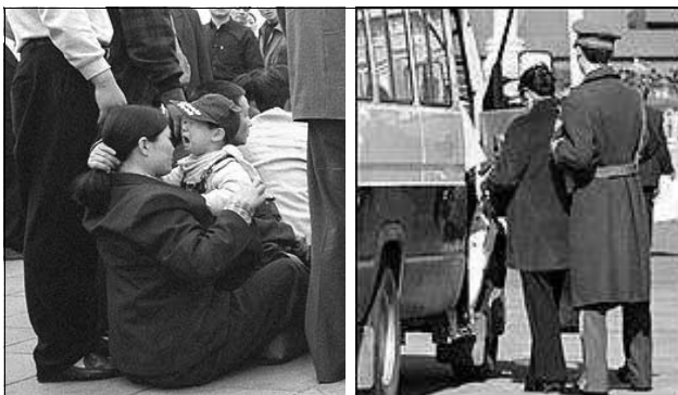
学员天安门广场被拘捕