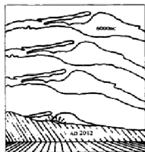
图2. 公元前6000年至2012年之间，银河系和冬至的太阳重合的过程。

十年的大事(1992-2001)，唯有李洪志先生所倡导的以宇宙精神“真善忍”为修炼原则的法轮大法被认为正在起着净化地球的作用。我后来又发现了两个有意思的数字，1992年正是李洪志先生在社会上公开传法轮大法的第一年。从1992年到1999年短短7年时间里，中国的修炼者已达近亿之众。李洪志先生使得众多的修炼者从拜金纵欲的社会死圈中走出来，教修炼者学会反思，用修炼