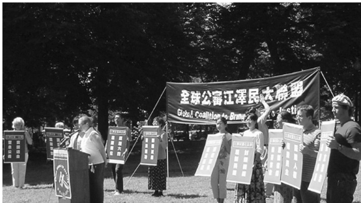
圖片：8月23日下午，全球審江聯盟於波士頓市中心公園集會。

10月江被首次告上美國法庭後，瑞士、英國、澳洲、加拿大等國法輪功學員已陸續宣佈將在本國將江告上