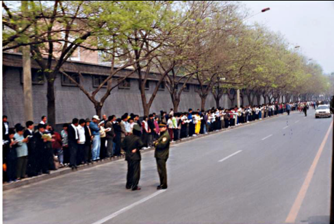
4.25和平上访，秩序井然

1999年4月25日，万余名大陆的法轮功学员次序井然地前往中南海集体上访，和平地请求政府给予一个自由合法的炼功环境。和平上访的起因之一是天津公安局非法扣留法轮功学员。中国科学院的何作麻在天津教育学院发行的一杂志上发表了一篇歪曲法轮功事实的文章。为了端正视听，一批天津学员抱着善心前往教育学院及有关机构反映实情，不想警察到场，无理殴打、驱赶学员，45名学员被抓。为了要求释放无辜学员，并给法轮功一个合法地位和宽松的修炼环境，同时解决长期以来法轮功受压制的局面，学员们于天津事件两天后的4月25日前往北京，向中央政府上访请愿。由于在此之前其它地区也出现过类似的对法轮功及其学员的