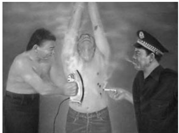
画展作品：吊铐火焰逼「转化」

2004年7月15-16日，以“坚忍不屈的精神”为主题的绘画展览在美国国会众议院瑞本大楼展览大厅举行。十位中西方画家（法轮功学员）创作的34幅作品参展，其中四人曾在中国因修炼法轮功被关进监狱。画展展示了五年来大陆法轮功学员遭受的血腥迫害以及所表现的坚忍不屈精神，并表达了光明终将战胜黑暗的信心。很多观众深受震撼，表示希望帮助法轮功学员，尽早结束迫害。