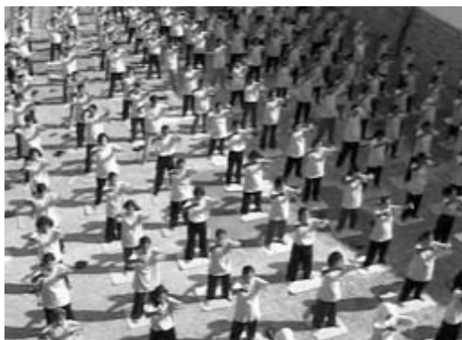
图片说明：上班前职工在炼功

【慧园】在美丽的印尼爪哇岛梭罗市郊，有一家拥有两百多名职工的私企纺织厂。两年前工厂主人在电视上看到法轮功的消息后，主动联络法轮功学员，了解真相后开始修炼法轮功。之后，把工厂职工带动起来，集体炼功学法。他们每天在