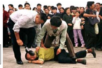
警察在光天化日之下施暴