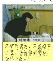
不穿隔离衣，不戴帽子口罩，话筒伸到嘴边，无异于杀人！

大家知道，人身上着火，身体周围的气体温度非常高，这时人当呼吸吸入灼热气体，必然会烧伤舌头、声带、气管。但电视上显示，“王进东”坐在广场，火已经灭了，但却声如洪钟地大喊：宇宙大法是人人必经的大法，（这不是大法的内容）躺在地下的小女孩也是声音清脆，而且说话底气十足，这难道不蹊跷吗？疑点六：小思影气管切开依然说话唱歌