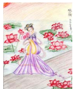
真善忍美好的世界

75岁的婆婆病重，叫我们夫妇俩赶快回家，赶回去见婆婆吃不下东西，人瘦得皮包骨头，公公吩咐我们准备后事。我坐在婆婆床头，给她讲修炼法轮功小故事，婆婆笑了说：“你说的事我爱听。”于是我每天都给她念《转法轮》和修炼故事，每天她都仔细地听着。就这样，她的精神也越来越好，慢慢地能下地了，后来能出门溜达了，脸色也红润起来了，十几天的时间，她的