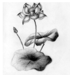
小弟子元元喜欢画荷花，因为荷花圣洁

在99年7.20前不久，他在一个偶然的机会得法。他如饥似渴地一遍又一遍看《转法轮》。时间不长，邪恶的当权者就开始打压迫害法轮功。他回家就向自己的父亲讲什么是法轮功，大法弟子信仰真善忍，都是好人。可是，他父亲根本听不进去。随着迫害进一步的残酷，他父亲为了保自己的官职向他宣布：如果他还不放弃法轮功，也把他抓到公安局关起来。在这种