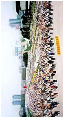
中国广州的一法轮功炼功点的学员们在晨炼(1998)