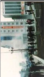
1999年5月（镇压前） 上图：地方公安用高压水枪 喷练功的学员 下图：地方公 安用高音喇叭干扰学员练功