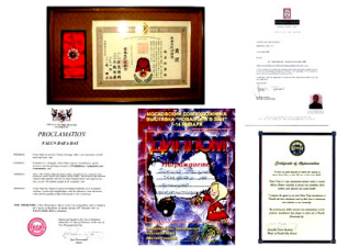
来自世界的部分褒奖

法轮大法在全世界 50 多个国家，特别是亚洲、澳洲、欧洲、北美，正在得到各界有缘之士越来越多的理解和珍视。近年来国际社会鉴于李洪志老师和法轮大法对人类