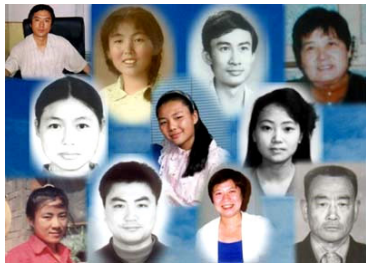
部分被迫害致死学员照片

据不完全统计，截止至 2003 年 1 月 30 日，能够详细核实的已有 564 名法轮功学员被迫害致死。据 2001 年 10 月底中共官方内部统计，拘捕中的法轮功学员死亡人数高达 1600 人；全国被非法判刑的法轮功学员至少有 6000 人；被非法劳教的人数超过 10 万人；数千人被强迫送入精神病院受摧残；大批法轮功学员被绑架到各地“洗脑班”遭受精神折磨。众多法轮功学员被打死打伤、妻离子散、居无定所、流离失所，亿万法轮功学员的家属、亲朋好友和同事受到不同程度的株连与洗脑。