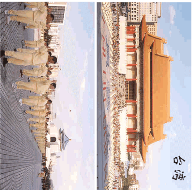
图片报道：台湾学员中正纪念堂炼功洪法

台湾大法学员 2003 年 3 月 15 日下午在中正纪念堂炼功洪法。当炼功音乐响起时，四周的人也停下来静静的看，也有跟着学的，就在这样和的环境下度过了一个美好的周末。