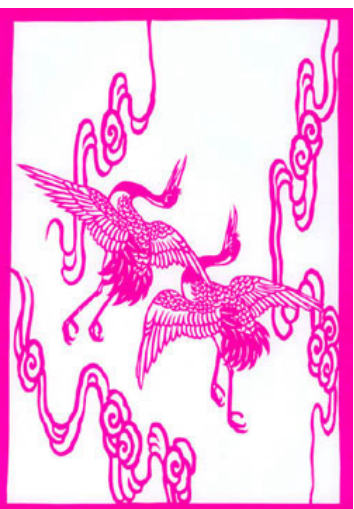
中国大陆学员剪纸作品