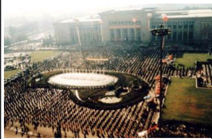
98 年 10 月 1 日法轮功学员在河北省博物馆广场炼功，九千多人参加