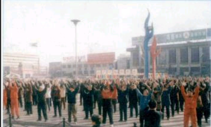
法轮功学员在石家庄火车站广场炼功

从照片上可以看出，99 年 7.20 镇压前法轮大法在石家庄蓬勃发展，尤其至 1998 年和 1999 年人数激增，法轮大法以其神奇的祛病健身功效和注重修心重德、道德升华的特点，吸引了越来越多的本地有缘之士走入修炼。