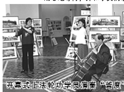
开幕式上法轮功学员演奏“普度”