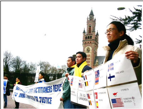
2003 年 11 月 26 日下午 1 点，全球审江大联盟在海牙国际法庭前举行审江公众听证会，并于当日下午 3 点向海牙国际法庭首席法官递交了世界各国起诉江泽民的书面材料，提出审判江泽民的要求。