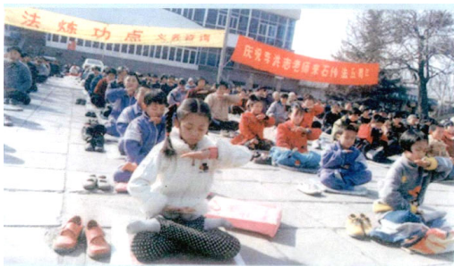
广场炼静功 小学员在石家庄青少年

髓。一头秀发因大剂量化疗、放疗掉光了，短短几天体重减了26斤。手术导致一系列后遗症：肾上腺皮质功能减退症、心脏间歇等，由于输血问题又得了丙型肝炎。这些病中任何一种都能很轻易地要了她的命。为了治肾上腺皮质功能减退症，一个月花了几千元也没治好，最后只能依靠每天口服5毫克激素维持生命。而丙型