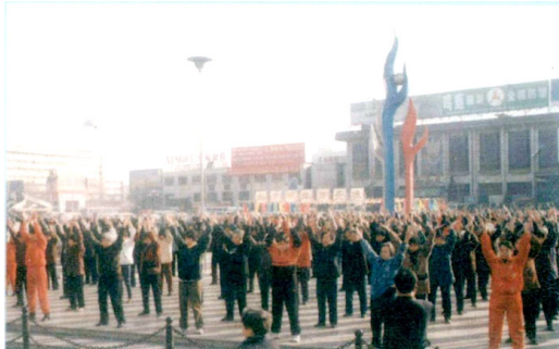
法轮大法修炼者在石家庄火车站广场炼功