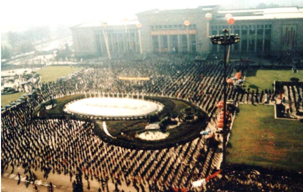
98 年庆“10.1”法轮大法修炼者在河北省博物馆广场炼功，九千多人参加

99 年 7.20 镇压前法轮大法在石家庄蓬勃发展，尤其至 1998 年和 1999 年人数激增，法轮大法以其神奇的祛病健身功效和注重修心重德、道德升华的特点，吸引了越来越多的本地有缘之士走入修炼。