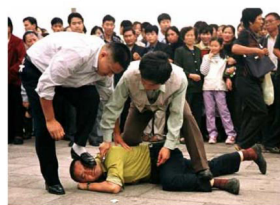
为什么如此害怕百姓的声音

可心亭派出所长期恐吓、利诱法轮功学员的亲人对法轮功学员进行监控和管制，并挑起家庭矛盾，致