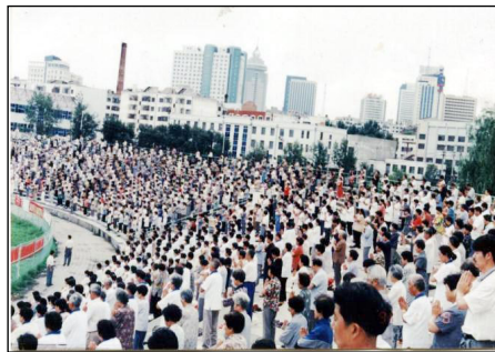
99 年镇压前哈尔滨三万法轮功学员晨炼

但是从社会上反映的情况来看，对法轮功有些误解，争议，我们通过了解有些问题已经弄清了，但是还要进一步调查了解。刚才我讲了，就反映出这些问题，我们的想法，