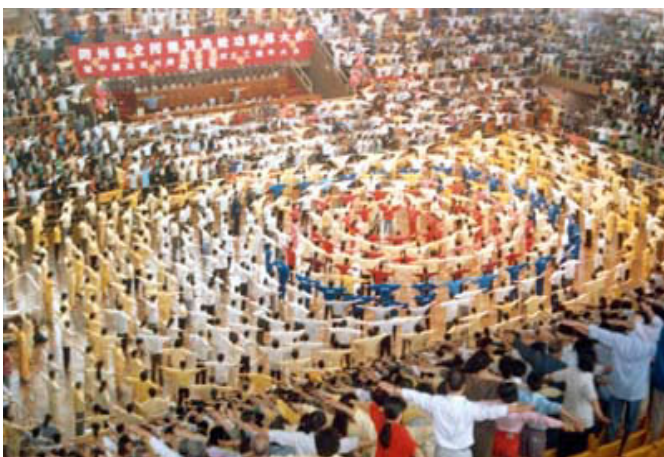
贵州修炼心得交流会和大型炼功（1999年镇压开始之前）