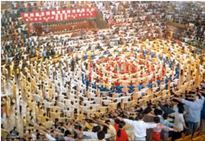
贵州修炼心得交流会和大型炼功（1999年镇压开始之前）