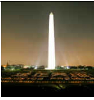
2003. 7. 27 华盛顿 DC 法轮功学员排字“法正天地”。