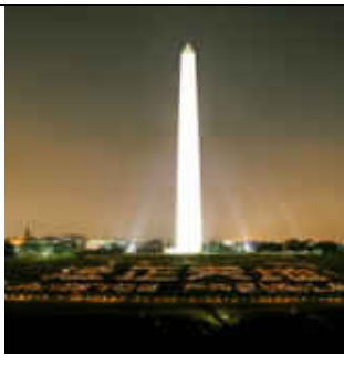
2003. 7. 27 华盛顿 DC 法轮功学员排字“法正天地”。