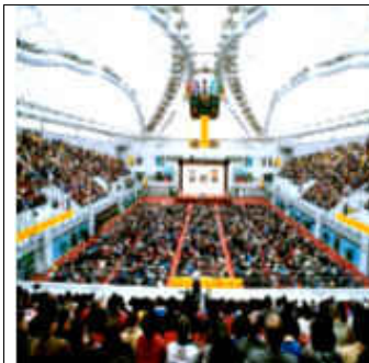
2002. 12. 30 台湾法轮功心得交流会，有 7000 多人参加了这次盛会。

目前在世界上有六十多个国家拥有法轮功修炼者，修炼者按照“真善忍”修心向善，获得了健康的身体和高尚的道德。