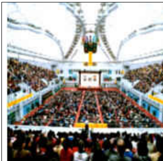
2002. 12. 30 台湾法轮功心得交流会，有 7000 多人参加了这次盛会。

目前在世界上有六十多个国家拥有法轮功修炼者，修炼者按照“真善忍”修心向善，获得了健康的身体和高尚的道德。