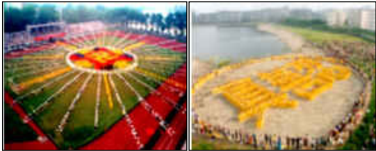
这是由 5000 多法轮功学员集体炼功，列队组字。 “法轮图形” “真善忍”。 中国，武汉(1997)