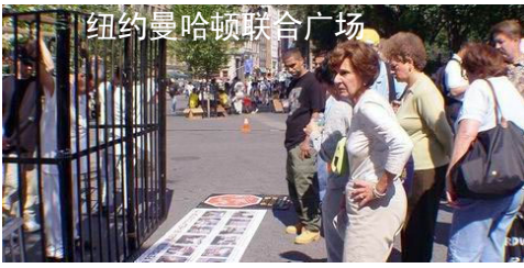
纽约曼哈顿联合广场

【明慧网 2004 年 10 月 1 日】9 月 24 日至 27 日，英国法轮功学员在苏格兰 3 大城市格拉斯哥、阿伯丁及邓迪巡回举办反酷刑展揭露在中国发生的迫害，签名支持全球公审江泽民的民众络绎不绝。当地的报纸、电台报导了此次法轮功学员举办的反酷刑展。