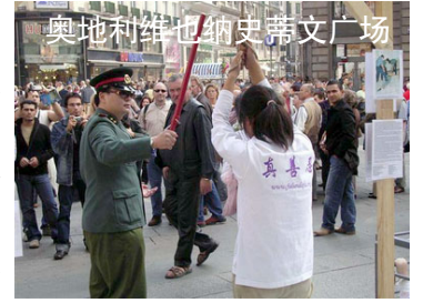
奥地利维也纳史蒂文广场

【明慧网 2004 年 10 月 5 日】2004 年 10 月 2 日，奥地利法轮功学员在维也纳市中心史蒂文广场举办了反酷刑展，揭露江氏集团对法轮功学员的残酷迫害。游客们看到在中国发生的酷刑的模拟表演