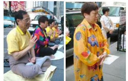
从左至右： 黄先生和黄太太

从攀谈中得知他事业上的成功可以追溯到他年轻的时候，起初他从事教育事业，在他 31 岁的时候就是香港的一家公立学校的校长，也是当时全香港最年轻的一位校长，这个职位在香港也算是高级官员的待遇。但他依然不满意已有的成就，那时的香港经济蓬勃发展，充满商机，他打算弃文经商，期望能在事业上有新的突破。他的朋友们都劝