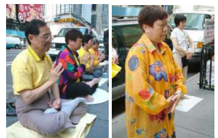
从左至右： 黄先生和黄太太

从攀谈中得知他事业上的成功可以追溯到他年轻的时候，起初他从事教育事业，在他 31 岁的时候就是香港的一家公立学校的校长，也是当时全香港最年轻的一位校长，这个职位在香港也算是高级官员的待遇。但他依然不满意已有的成就，那时的香港经济蓬勃发展，充满商机，他打算弃文经商，期望能在事业上有新的突破。他的朋友们都劝