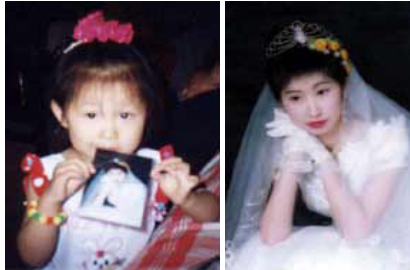
小开心正在 亲吻妈妈的