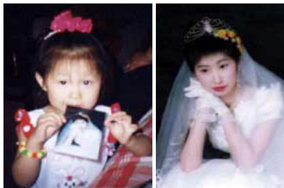
小开心正在 亲吻妈妈的