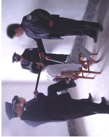
如上图所示:将大法学员铐在椅子上, 4、5名警察用电棍电。

潍坊劳教所迫害法轮功学员酷刑图示 (部分) 潍坊市劳教所 (昌乐劳教所) 位于昌乐县城东郊