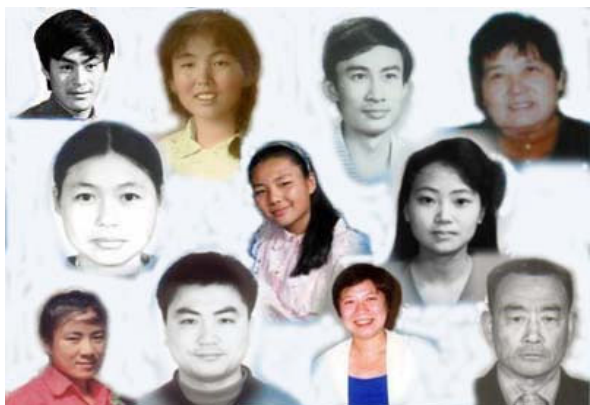
以上图片只是被迫害致死的部分法轮功学员

据不完全统计，1999年7.20以来的五年中，通过民间途径能够传出消息的已有 1089 名法轮功学员被迫害致死，据明慧网消息，死亡案例高发地区依次为黑龙江、吉林、辽宁、河北、山东、四川、湖北。在被迫害致死者中，妇女约占 51.37%，50 岁以上的老人约占 38.86%