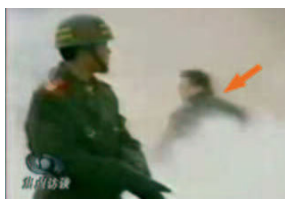
4、打击者仍保持用力姿势