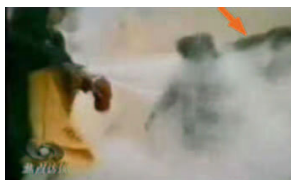
1、刘头部受到一记重击