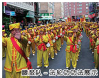
晨鼓队—法轮功功法展示