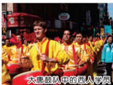
大唐鼓队中的西人学员