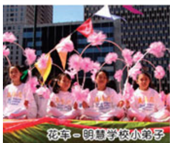
花车—明慧学校小弟子