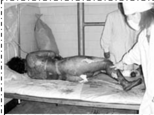
烧伤病人要在空气中晾着，护理人员要穿卫生服，戴口罩以防感染。

国际组织： 国际教育发展组织（IED）在 2001 年 8 月 14 日联合国会议上发表声明指出：2001 年 1 月 23 日天安门广场的自焚案是由江泽民政府一手导演的，并向会议提交了该案的分析录像带。