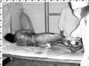
烧伤病人要在空气中晾着，护理人员要穿卫生服，戴口罩以防感染。

国际组织： 国际教育发展组织（IED）在 2001 年 8 月 14 日联合国会议上发表声明指出：2001 年 1 月 23 日天安门广场的自焚案是由江泽民政府一手导演的，并向会议提交了该案的分析录像带。