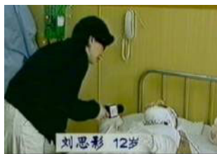
记者未穿防护服，“烧伤者”

再有，烧伤患者包裹得那么严，这根本不符合医学常识。那个做了气管切开手术的小学生，气管切开插上管子呼吸，还能底气十足、声音清脆地接受采访及唱歌，简直是笑话。