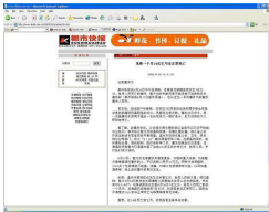
图一：都市快报网页文章 (2003-07-02 10:31:18)