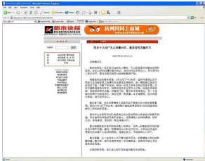
图三：都市快报网页文章 (2003-05-20 09:54:13)