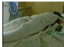
焦点 访谈 节目 镜头

有位医生很有辨别是非善恶的能力。江氏邪恶流氓集团编造导演了“天安门自焚”事件后，凡是去他门诊看病的患者和闲坐的客人，他都对他们讲真象。他说：“我们都去过天安门，哪有武警背着灭火器和灭火毯巡逻的？人民大会堂离天安门那远，就是把灭火器拿来也得好一阵子，人早烧焦了，为什么人着了，而腿中间的塑料瓶没着？正好录音机就在那放着，把这一切全录下来了？这一切都是江××一伙栽赃法轮功的……”他又说：