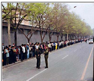
上访学员安静祥和，警察没事

法轮功学员们在街两边的人行道上安静祥和地排着队，边看书边等待着信访。后来，朱熔基总理亲自接见了学员代表，下令天津公安局放人，并重申了国家不会干涉群众炼功的政策。当晚10点左右，学员们悄然离去。整个过程，平静祥和，秩序井然。上万人离开后，地上没有留下一片纸屑，连警察扔在地上的烟头都拣得干干净净。