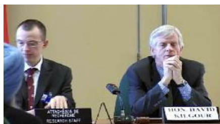
人权和国际发展小组主席大卫-乔高 (David Kilgour) 参加听证会

【明慧网2004年12月4日】2004年12月2日，“因信仰受迫害者听证会”在加拿大国会举行。加拿大法轮大法协会代表出席并在听证会上作证。加拿大国会外交委员会人权和