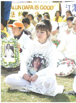
来自四十多个国家的上千名法轮功学员向各界人士发出呼吁，共同制止中国对无辜的法轮功学员的迫害。 (2003 年 3 月 17 日，瑞士日内瓦，第 59 届联合国人权大会开幕之际)

我和六、七名学员被非法关押在七、八平方米的小屋里两天两夜。7 月 2 日晚，我被送到济南市刘长山拘留所和一些杀人犯、诈骗犯等刑事犯人关在一起，一个月时间，过着非人的生活，十八个人睡在不足 20 平方米的水泥地板上。吃喝拉尿洗澡都在这一个监号里，发霉的馒头和清水煮白菜帮都不让吃饱。