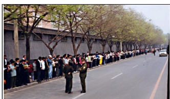
学员没有标语口号没有阻塞交通 等后十几个小时离开时把环境清理的干干净净。

答：1999 年 4 月 25 日，一万多名法轮功学员到国务院信访办上访，是因为 4 月 23 日在天津 40 多名学员被违法关押，地方政府告知没有北京的授权，学员得不到释放。学员们基于对政府的信任，用宪法 41 条赋予的上访权，本着善念，希望政府能公平对待法轮功。在获得朱镕基前总理的接见后，学员就平和地离去，离去时还把地上的垃圾全清理干净，所有事情圆满解决。