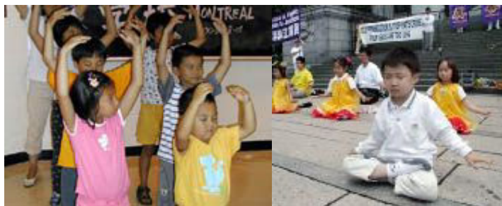
蒙特利尔明慧学校