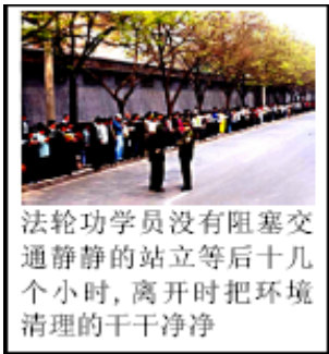
法轮功学员没有阻塞交通静静的站立等后十几个小时，离开时把环境清理的干干净净

“天安门自焚案”是在谎言、镇压难以维持之际，新华社制造的栽赃陷害法轮功的恶性案件。新华社在 2001 年 1 月 23 日的“天安门自焚事件”发生两个小时后，在缺乏证据的情况下，立即宣布自焚者为“法轮功学员”，并借此对法轮功进行批判和诋毁。然而，华盛顿邮报菲利普·潘对在“自焚”