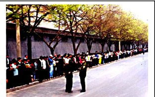
法轮功学员没有阻塞交通静静的站立等后十几个小时，离开时把环境清理的干干净净