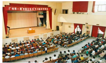
广州第二期法轮功学习班 (1993-10)

在99年前的一项调查表明，广东省有近25万人修炼法轮功，《羊城晚报》1998年11月10日刊登了一则报道：8日早上，广东省体委武术协会有关领导到广州烈士陵园等处，观看了5000法轮功爱好者的大型晨练活动。炼功者来自各行各业，年龄最大的93岁，最小的仅两岁。法轮功修炼者遍布广东省的城镇和乡村。