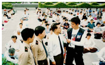
广州电视台采访法轮功学员 (1998)