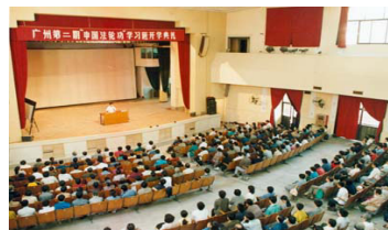
广州第二期法轮功学习班 (1993-10)

在99年前的一项调查表明，广东省有近25万人修炼法轮功，《羊城晚报》1998年11月10日刊登了一则报道：8日早上，广东省体委武术协会有关领导到广州烈士陵园等处，观看了5000法轮功爱好者的大型晨练活动。炼功者来自各行各业，年龄最大的93岁，最小的仅两岁。法轮功修炼者遍布广东省的城镇和乡村。