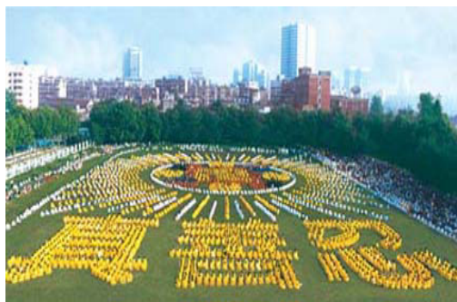
由 5000 多法轮功学员集体炼功，列队组成“法轮图形”和“真善忍”

1992 年 5 月至 1999 年 7 月的七年间，法轮功靠人传人、心传心，传遍中国大江南北，据 98