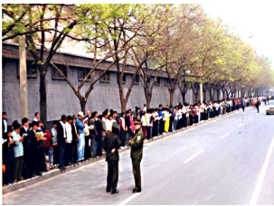
法轮功学员没有阻塞交通静静的站立等候十几个小时，离开时把环境清理的干干净净

※ 1998年下半年，以乔石同志为首的部分全国人大离退休老干部，根据大量群众来信反映公安非法对待法轮功炼功群众的问题，对法轮功进行了一段时间的详细调查、研究，得出“法轮功于国于民有百利而无一害”的结论，并于年底向江泽民