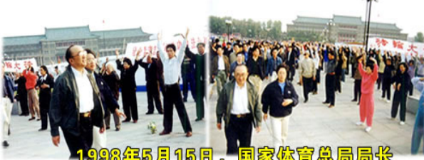
1998年5月15日, 国家体育总局局长伍绍祖亲赴法轮大法发祥地长春考察