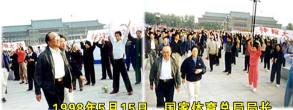
1998年5月15日, 国家体育总局局长伍绍祖亲赴法轮大法发祥地长春考察

◆ 法轮功所传之处, 人心向善, 道德回升。《大连日报》1997 年 3 月 17 日载文“无名老者默默奉献”, 报导了一位名叫盛礼剑的古稀老人, 利用一年时间, 默默为村民修了 4 条全长约为 1100 多米的公用道路。当人们问他是哪个单位的、拿了多少钱时, 老人说: “我是学法轮功的, 为大伙做点好事不要钱”。