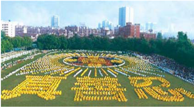
(1997，湖北省武汉市，由 5000 多法轮功学员集体炼功，组成“法轮图形”和“真善忍”)

年7月的七年间，法轮功靠人传人、心传心，传遍中国大江南北，据98年底中国政府的一项统计显示，全国学炼法轮功者达七千多万之众。