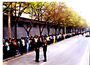
法轮功学员没有阻塞交通，静静的站立等候十几个小时。