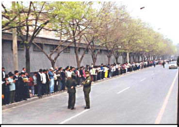
学员没有标语口号、没有阻塞交通，等候十几个小时。离开时还把环境清理干净。

4月25日当天，上万名闻讯而来法轮功群众没有口号、没有标语，安静有秩序的在北京国务院信访办等候了十几个小时。总理朱镕基接见了学员代表，令天津公安局放人，并重申了国家不会干涉群众炼功的政策。当晚9点多，学员们悄然离去。整个过程，平静祥和，秩序井然。离开后，地上没有留下一片纸屑。