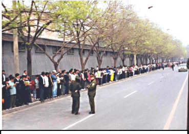
学员没有标语口号、没有阻塞交通，等候十几个小时。离开时还把环境清理干净。

4月25日当天，上万名闻讯而来法轮功群众没有口号、没有标语，安静有秩序的在北京国务院信访办等候了十几个小时。总理朱镕基接见了学员代表，令天津公安局放人，并重申了国家不会干涉群众炼功的政策。当晚9点多，学员们悄然离去。整个过程，平静祥和，秩序井然。离开后，地上没有留下一片纸屑。