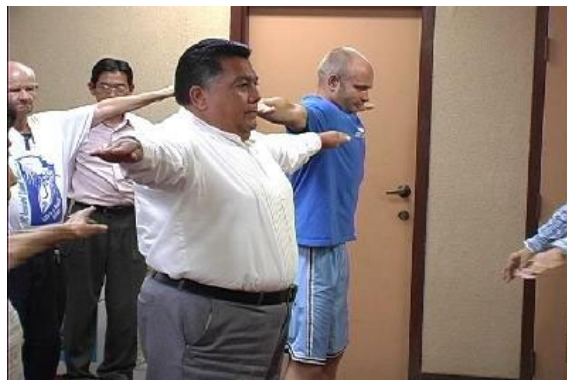
雷蒙德·卡斯迪罗市长在学炼法轮功

2004 年 6 月 19 日下午，美国加州埃尔森绰（ElCentro）市雷蒙德·卡斯迪罗（Raymond Castillo）市长及邻近的布劳利（Brawley）市市长希尔兹（M. Jo Shields）先生给法轮功颁发了褒奖状。宣布 6 月 19 日至 6 月 26 日为帝王县第一届法轮大法周。在褒奖状中，两位市长高度赞扬法轮功及其创始人李洪志先生，对改善人们身体健康及提升社会道德水准方面的贡献。卡斯迪罗市长兴致勃勃地和市民一起学练法轮功的五套功法。