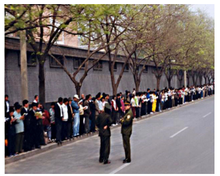
学员没有标语口号没有阻塞交通

因为罗干设下圈套，事先封闭各路口唯独留下中南海一条路，公安刻意诱导学员分为两路把中南海围成一圈形成所谓的“包围中南海”进行栽赃陷害，他们滥用手中的权力和人民对政府的信任，控制所有新闻媒体把1999年4月25日和平上访变成了日后对法轮功发动蓄谋已久的镇压的导火线。