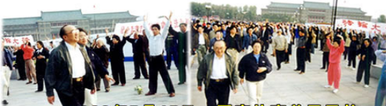
1998年5月15日，国家体育总局局长伍绍祖亲赴法轮大法发祥地长春考察