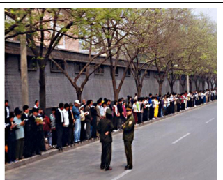
学员没有标语口号没有阻塞交通

因为罗干设下圈套，事先封闭各路口唯独留下中南海一条路，公安刻意诱导学员分为两路把中南海围成一圈形成所谓的“包围中南海”进行栽赃陷害，他们滥用手中的权力和人民对政府的信任，控制所有新闻媒体把1999年4月25日和平上访变成了日后对法轮功发动蓄谋已久的镇压的导火线。