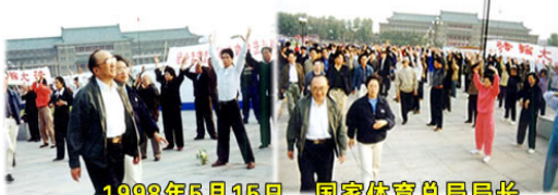
1998年5月15日，国家体育总局局长伍绍祖亲赴法轮大法发祥地长春考察